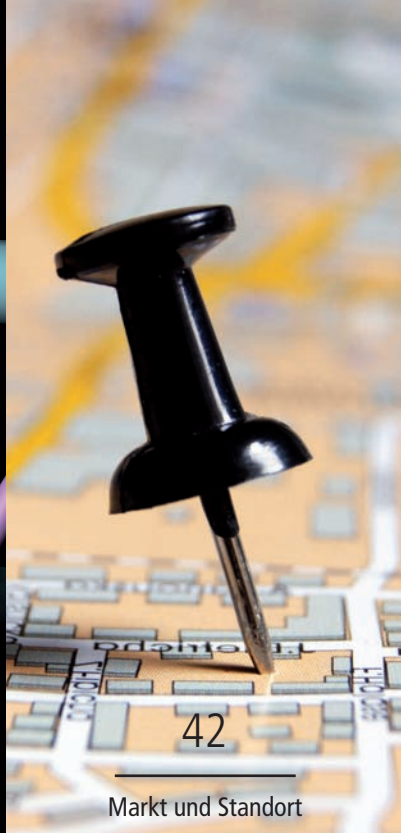
Markt und Standort