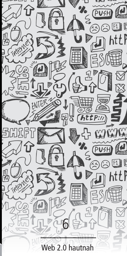
Web 2.0 hautnah